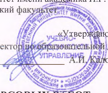
ГРАФИК ЗАЩИТЫ КУРСОВЫХ РАБОТ В ПЕРИОД ВТОРОЙ ПРОМЕЖУТОЧНОЙ АТТЕСТАЦИИ 2025 - 2026 учебного года ОБУЧАЮЩИХСЯ 6 КУРСА ФИНАНСОВО-ЭКОНОМИЧЕСКОГО ФАКУЛЬТЕТА специальность 38.05.02 ТАМОЖЕННОЕ ДЕЛО направленность (профиль) Таможенные платежи заочная форма обучения (6 лет)