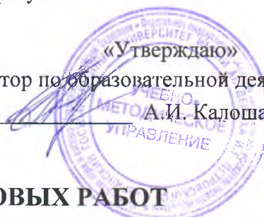
ГРАФИК ЗАЩИТЫ КУРСОВЫХ РАБОТ В ПЕРИОД ВТОРОЙ ПРОМЕЖУТОЧНОЙ АТТЕСТАЦИИ 2023 - 2024 учебного года ОБУЧАЮЩИХСЯ 5 КУРСА ФИНАНСОВО-ЭКОНОМИЧЕСКОГО ФАКУЛЬТЕТА направление подготовки 38.03.02 МЕНЕДЖМЕНТ направленность (профиль) Производственный менеджмент заочная форма обучения (5 лет)