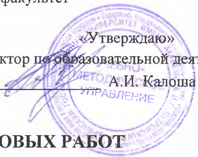
ГРАФИК ЗАЩИТЫ КУРСОВЫХ РАБОТ В ПЕРИОД ВТОРОЙ ПРОМЕЖУТОЧНОЙ АТТЕСТАЦИИ 2023 - 2024 учебного года ОБУЧАЮЩИХСЯ 5 КУРСА ФИНАНСОВО-ЭКОНОМИЧЕСКОГО ФАКУЛЬТЕТА направление подготовки 38.03.01 ЭКОНОМИКА направленность (профиль) Бухгалтерский учет, анализ и аудит заочная форма обучения (5 лет)