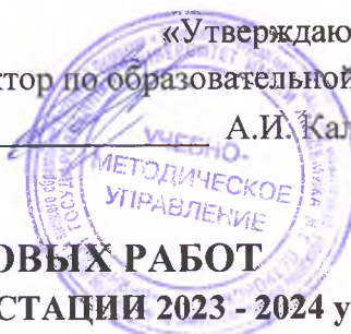
ГРАФИК ЗАЩИТЫ КУРСОВЫХ РАБОТ В ПЕРИОД ВТОРОЙ ПРОМЕЖУТОЧНОЙ АТТЕСТАЦИИ 2023 - 2024 учебного года ОБУЧАЮЩИХСЯ 5 КУРСА ФИНАНСОВО-ЭКОНОМИЧЕСКОГО ФАКУЛЬТЕТА специальность 38.05.02 ТАМОЖЕННОЕ ДЕЛО направленность (профиль) Таможенные платежи заочная форма обучения (6 лет)