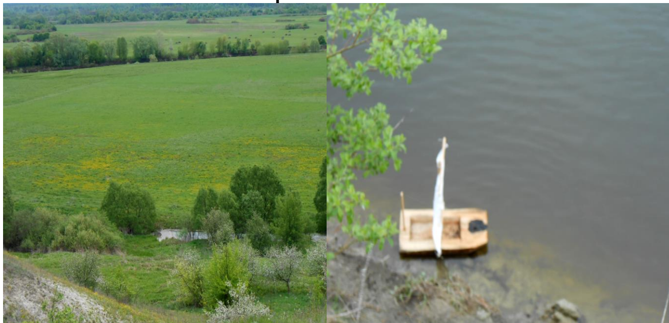
Рисунок 1 – Точки пробоотбора на р. Десна в районе д. Добрунь Брянского района