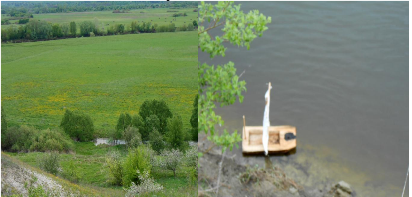
Рисунок 1 – Точки пробоотбора на р. Десна в районе д. Добрунь Брянского района