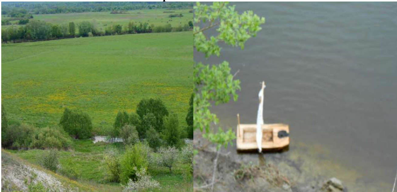
Рисунок 1 – Точки пробоотбора на р. Десна в районе д. Добрунь Брянского района