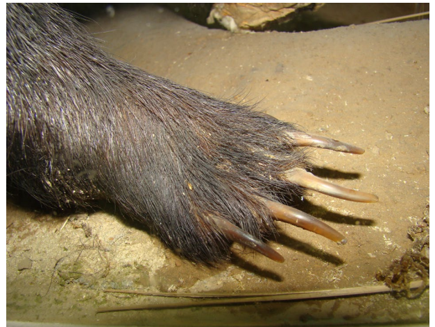
Рисунок 6 – Барсук европейский ( Meles meles )