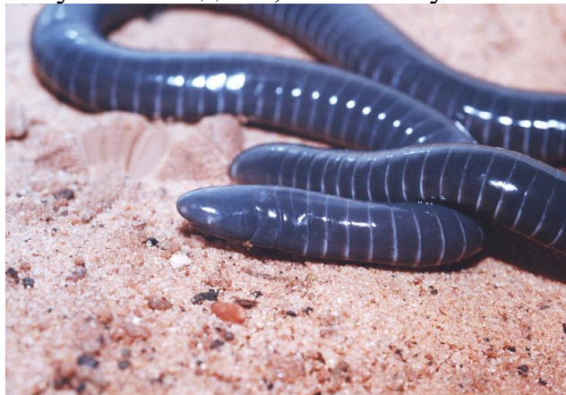
Рисунок 2– Червяга кольчатая

Рассмотрите рисунок 2. Червяга кольчатая обитает в Аргентине, Бразилии, Колумбии, Эквадоре, Боливии, Венесуэле, Перу под землей или в муравейниках, термитниках. Ученые отнесли её к классу Земноводные (Амфибии). Напишите как можно больше доказательств, почему данный вид можно отнести к классу Земноводные, а не к типу Кольчатые черви.