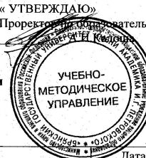
График защиты курсовых работ на 5 курсе Специальность 38.05.02 Таможенное дело направленность (профиль) Таможенные платежи финансово-экономического факультета в 9 семестре 2023-2024 уч. года по дисциплине «Таможенный контроль после выпуска товаров»