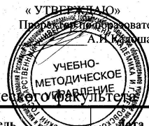
График ликвидации академических задолженностей по итогам зимней зачетно-экзаменационной сессии 2023-2024 уч. год финансово-экономического факультета