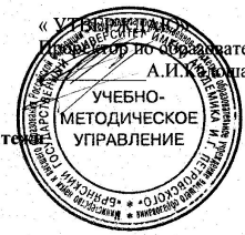
График защиты курсовых работ на 4 курсе Специальность 38.05.02 Таможенное дело направленность (профиль) Таможенные платежи финансово-экономического факультета в 7 семестре 2023-2024 уч. года по дисциплине «Таможенные платежи»