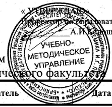
График ликвидации академических задолженностей по итогам зимней зачетно-экзаменационной сессии 2023-2024 уч. год финансово-экономического факультета