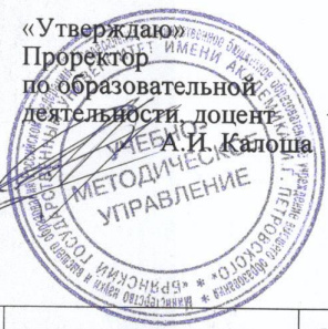
График защиты курсовых работ на 5 курсе направления подготовки (специальности) 44.03.05. Педагогическое образование (с двумя профилями подготовки) направленности (профили) История, Обществознание факультета истории и международных отношений в IX семестре 2023-2024 учебного года