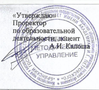
График защиты курсовых работ на 4 курсе направления подготовки (специальности) 48.03.01. Теология направленность (профиль) Государственно – конфессиональные отношения в православной традиции факультета истории и международных отношений в VII семестре 2023-2024 учебного года